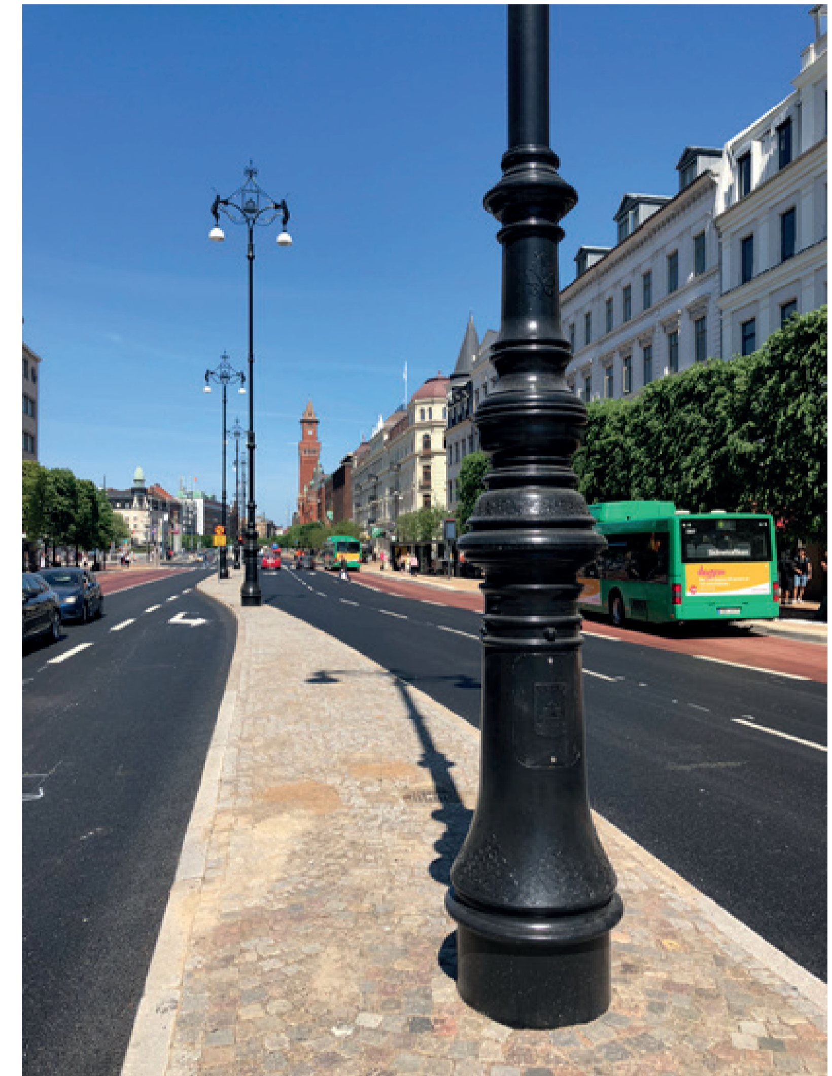
Gatans nya karaktär