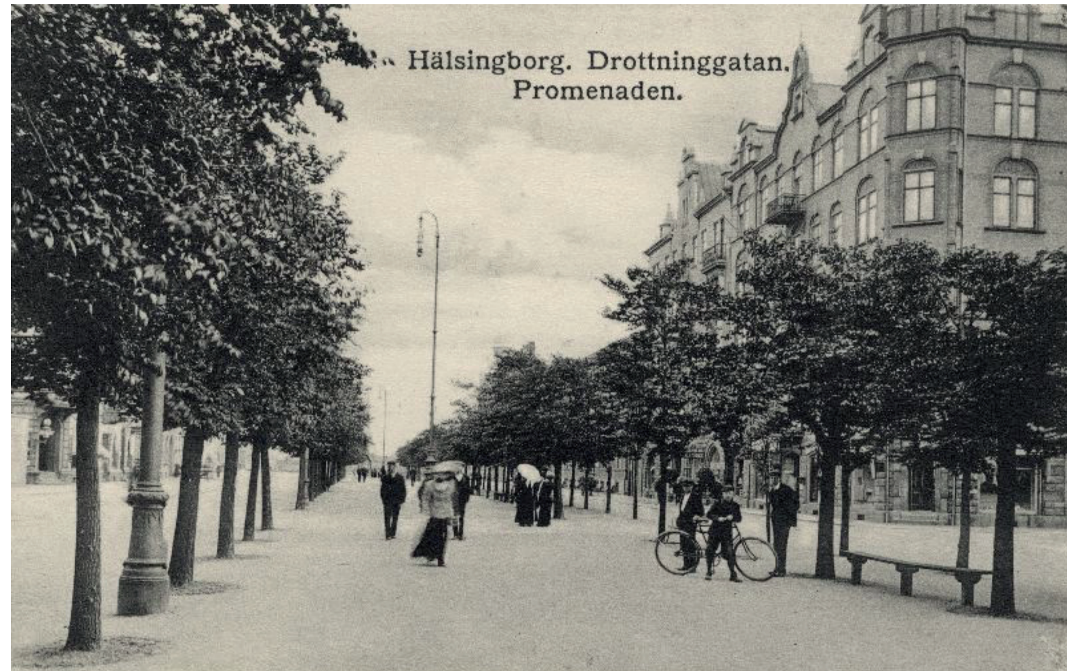
ca 1890 talet