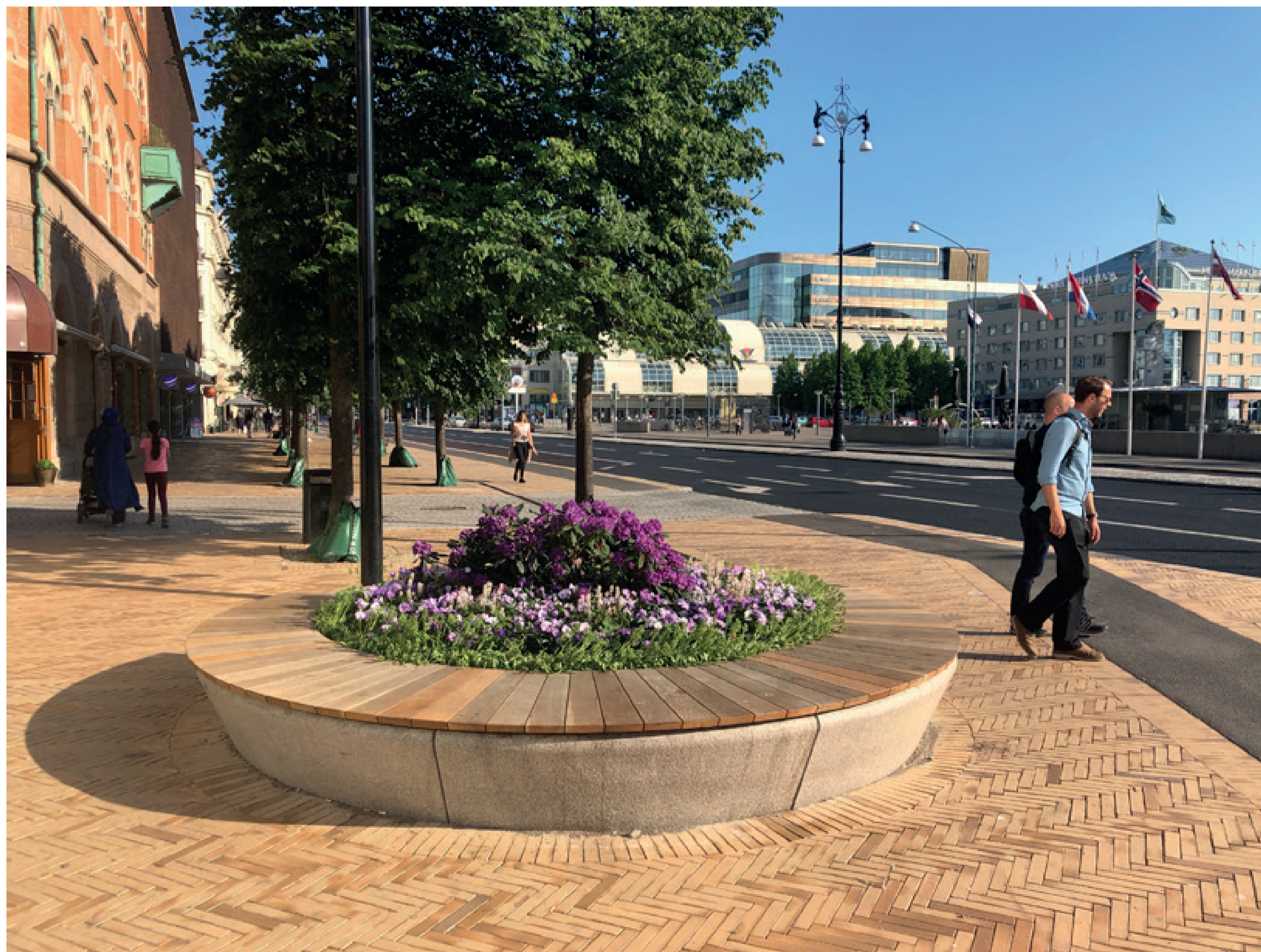
Fiskbensmönster och upphöjda planteringsytor