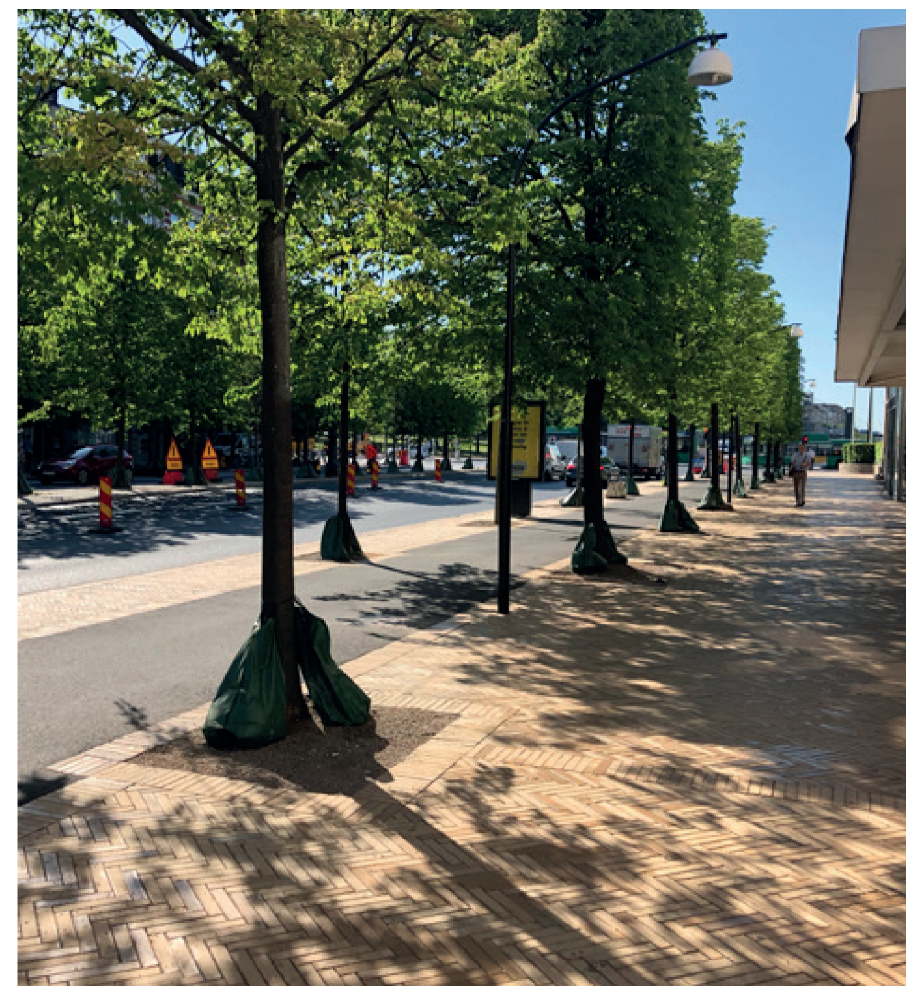
Gatans nya karaktär